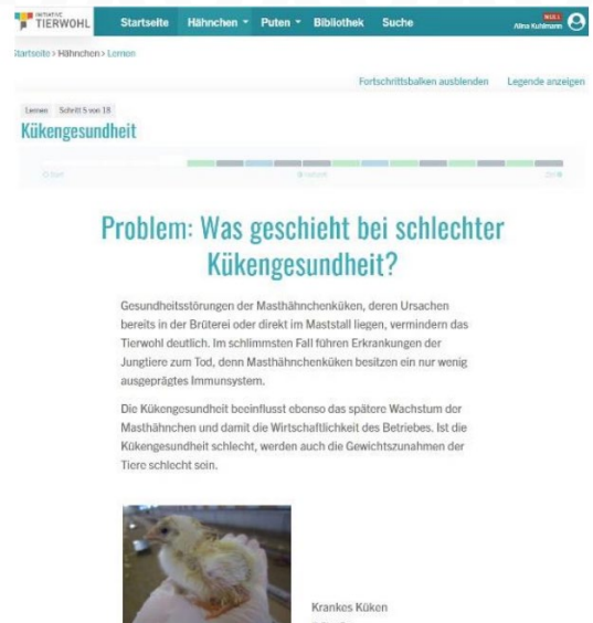
Abb. 2: Ausführliche Erklärung zu Problemen mit der Gesundheit junger Küken.