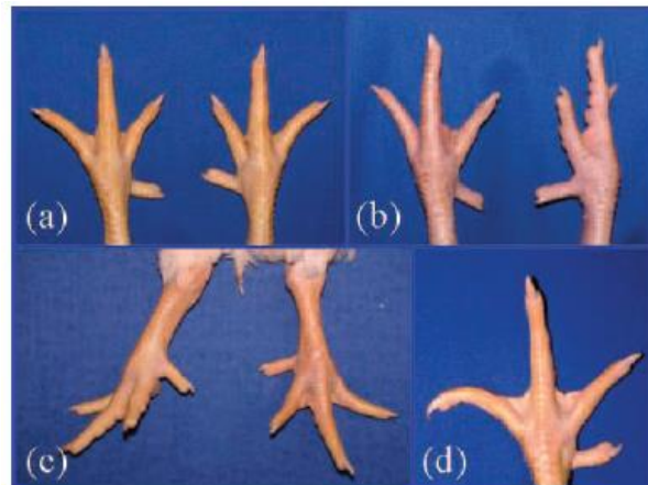
Figure 2 : Illustrations de (a) pattes saines (score 0) comparées à (b) et (c) des déformations des os longs (score 100) et (d) des doigts déviés (score 100) (Kapell et al., 2012).