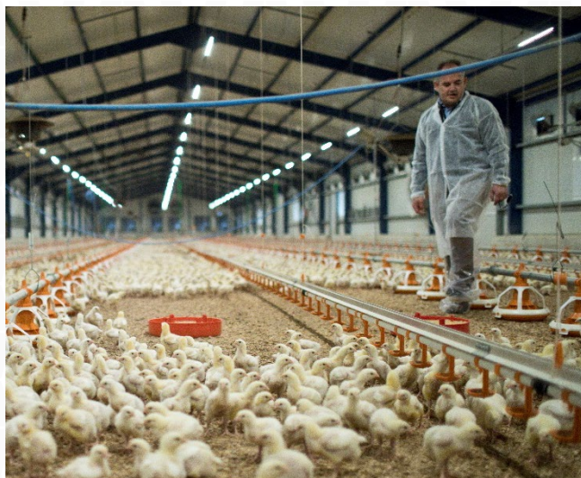
Abbildung 1. Bei der täglichen Kontrolle kann der Landwirt überprüfen, ob sich alle Vögel ordnungsgemäß bewegen. Veränderungen in der Bewegung der Vögel oder der Verteilung im Stall können erste Anzeichen für gesundheitliche Probleme sein.