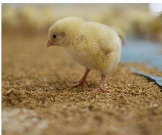
Νεοσσός μιας ημέρας

Για παράδειγμα, η ρήξη τενόντων ήταν ένα πρόβλημα που έχει κοινοποιηθεί και βελτιωθεί σημαντικά.