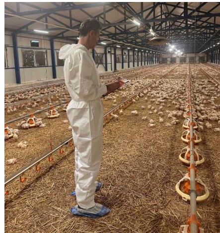
Ο πτηνοτρόφος παρακολουθεί το μικροκλίμα