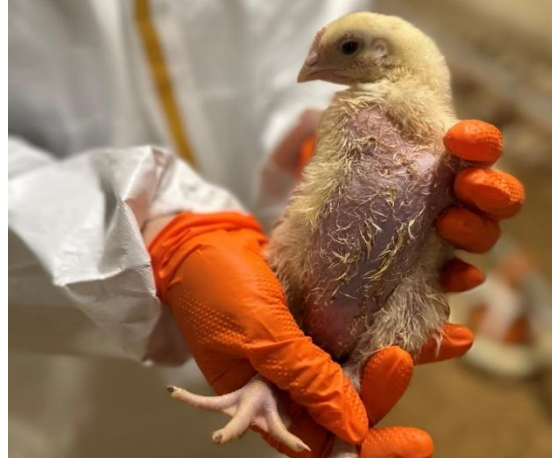
Αξιολόγηση της αποτελεσματικότητας της διαχείρισης του μικροκλίματος.