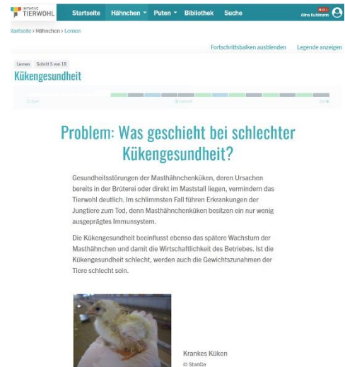
Abb. 2: Ausführliche Erklärung zu Problemen mit der Gesundheit junger Küken.